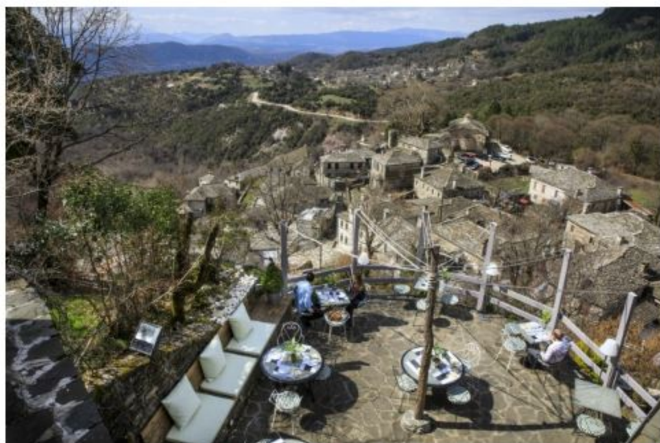
ギリシアの山岳地帯には隠れ家リゾートが多い