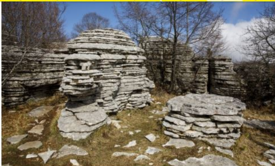
ストーンフォレスト

イピルス地方のコアともいえる、山々に囲まれたザゴリ地区は、2,497メートルのガミラ山を頂点にした美しい山の景色で知られています。ヴィコス・アオウス国立公園はユネスコのジオパークにも指定され、四季折々の美しい自然を楽しめます。固有種の植物は300種類も。