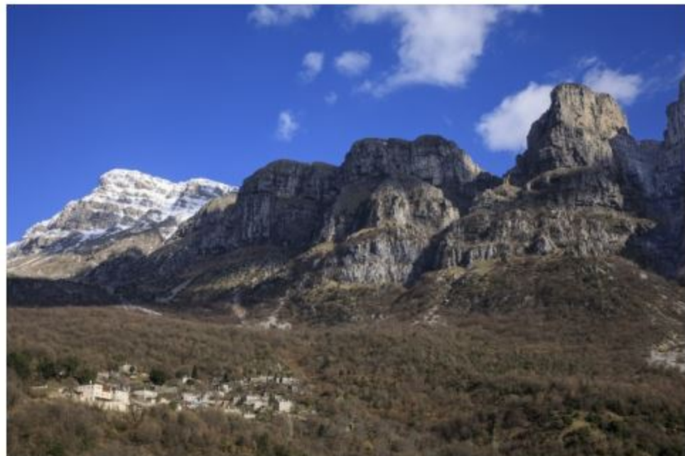
バビゴ村近くにそびえる山々

ザゴリ地方の山間には、46の小さい村（ザゴロフォリア＝ザゴリの村）が点在しています。村々の間の距離は車で30分ほどですが、それぞれに違う地形やたたずまいを持つ美しい村を訪ねるのがこの地方の楽しみです。石灰岩造りの古い家々はフォトジェニックで、夏のセカンドハウスを構える人も多いとか。